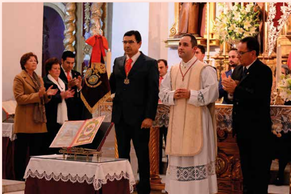
Toma de posesión nueva Junta de Gobierno 09/01/16

¡¡¡ Viva la Primera y Más Antigua Hermandad del Rocío!!!